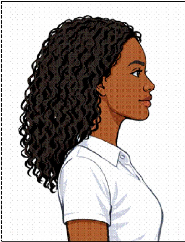
Modelo de foto de perfil